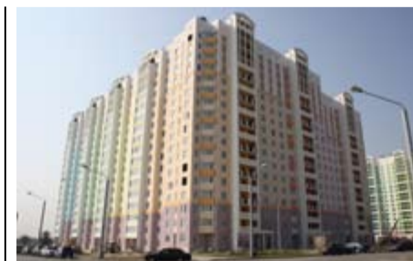
1-я очередь строительства