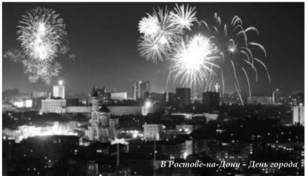
В Ростове-на-Дону — День города