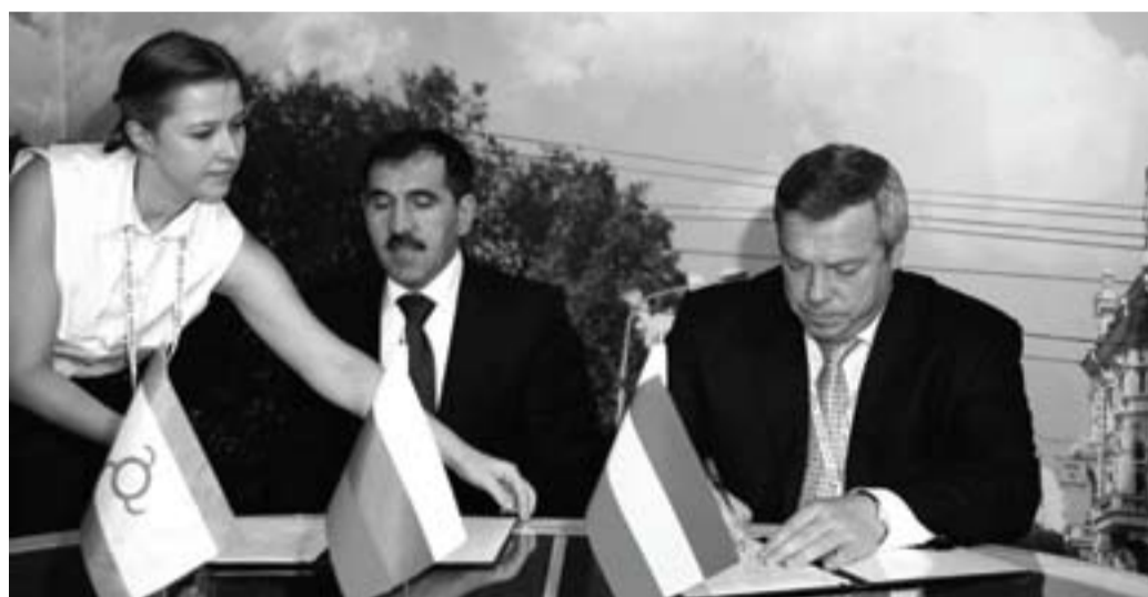
Подписание соглашения о сотрудничестве между Ростовской областью и Республикой Ингушетия