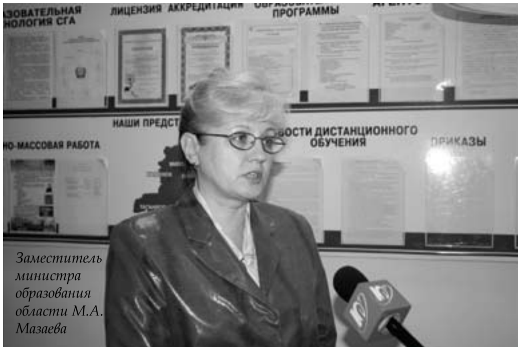
Заместитель министра образования области М.А. Мазаева