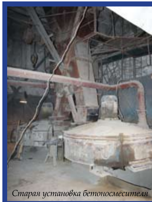
Старая установка бетоносмесителя