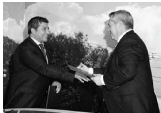
Подписание меморандума о сотрудничестве между администрацией Ростовской области и компанией «Аксай&Истанбул»