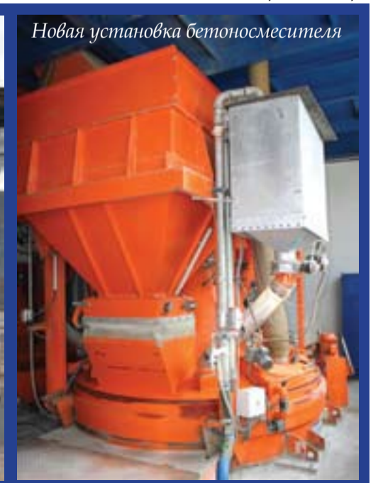
Новая установка бетоносмесителя