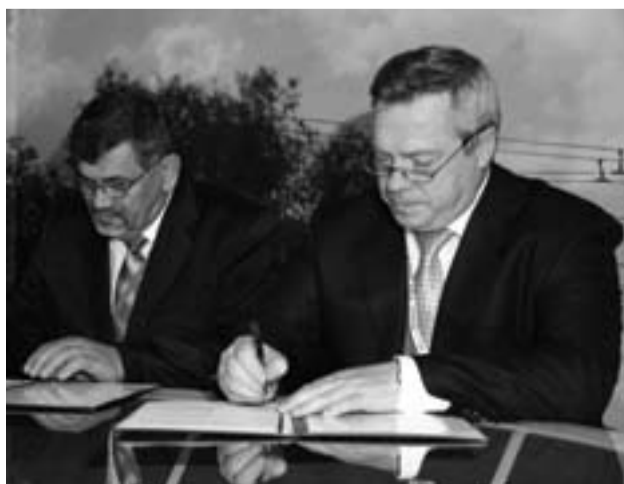
Подписание меморандума о сотрудничестве с компанией «Контур Глобал»